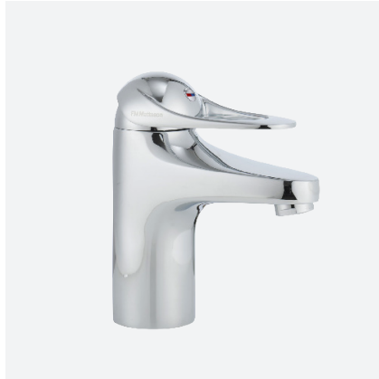
TVÄTTSTÄLLSBLANDARE 9000E, FMM