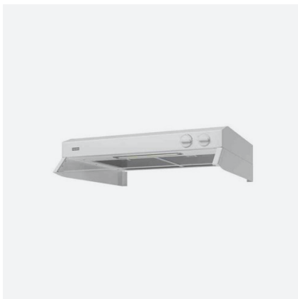
VOLYMKÅPA CLASSIC 60 VIT, FRANKE