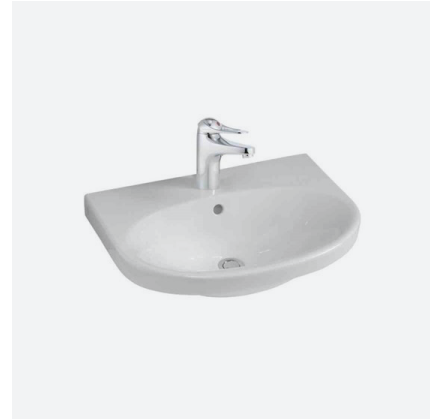
TVÄTTSTÄLLSPAKET NAUTIC, GUSTAVSBERG