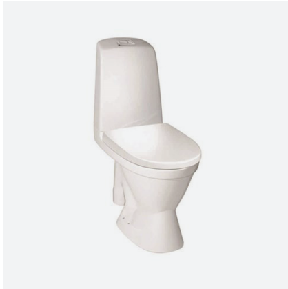
WC-STOL NAUTIC, GUSTAVSBERG