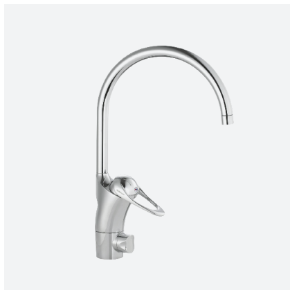
KÖKSBLANDARE 9000E, FMM

HSB Stockholm reserverar sig för eventuella tryckfel och förbehåller sig rätten till ändringar