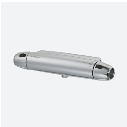
DUSCHBLANDARE 9000E, FMM